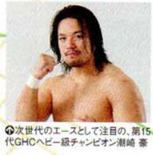
次世代のエースとして注目の、第15代GHCヘビー級チャンピオン 潮崎 豪